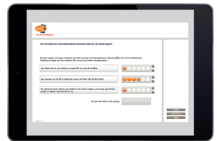
Skärmdump: Exempel på ett SJQ

Vi kombinerar psykometrisk kunskap och vår unika bedömningsmetod med bidrag från ämnesexperter för att skapa verkliga situationer och rimliga svarsalternativ. Vi utprövar alltid en prototypversion, analyserar data och gör lämpliga ändringar innan vi slutligen lanserar ett SJQ. Denna kvalitetssäkring innan lansering garanterar validiteten och att organisationen får ut så mycket som möjligt av sin investering. Formulärets utformning med poängfördelning, genom vilken kandidaterna bedömer lämpligheten hos varje svarsalternativ, ger oss mer information från varje fråga eftersom kandidaten får nyansera sina svar – dessutom uppskattar även kandidaterna detta format!